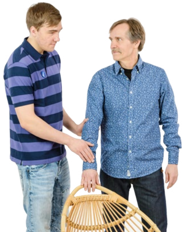
Opas vie yhteyskäden tuolin selkänojalle.

Opas kertoo, onko tuoli jotenkin erityinen, esimerkiksi pyörällinen, jakkara tai sijaitseeko se pöydän ääressä tai esteiden läheisyydessä. Opas ei vedä pöydän ääressä olevaa tuolia esiin, vaan näkövamma tekee sen itse, jolloin hän voi säädellä etäisyyden sopivaksi ja säilyttää kontaktin pöytään vapaalla kädellään.